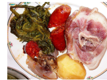
LACÓN CON GRELOS