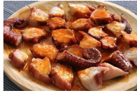
PULPO A FEIRA