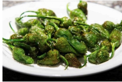
PIMIENTOS DE PADRÓN